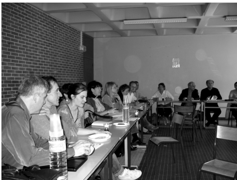
Le lycée J. Brel à La Cour-neuve.