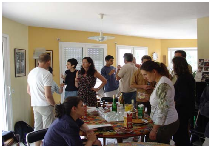
Une assemblée sympathique, une ambiance détendue

Puis article sur le sport et les trois dimensions (lycée sport étude montagne)