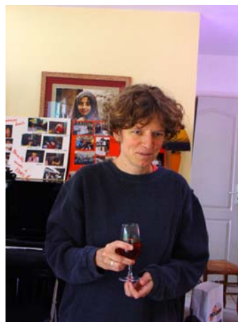
Notre trésorière, un verre à la main. Ca n'arrive qu'au SEL !